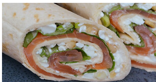
Dag 4 Madpandekager med laks og spinat