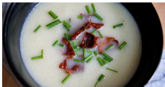
Dag 2 Nem blomkålssuppe