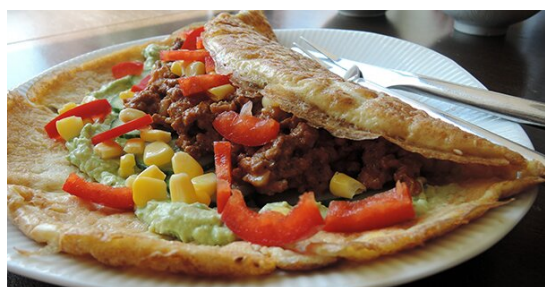
Dag 1 Æggewraps med fyld