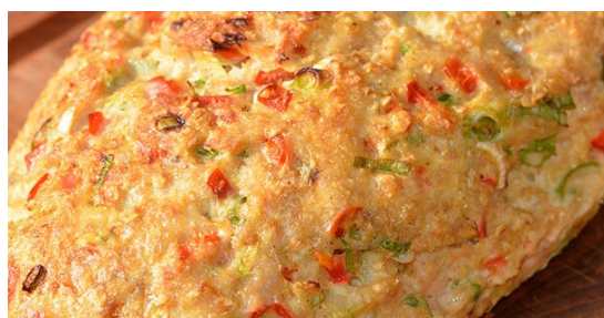
Dag 3 Kyllingefarsbrød med broccolisalat